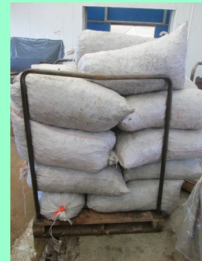
Заготовка одноглазковых черенков и хранение привоя