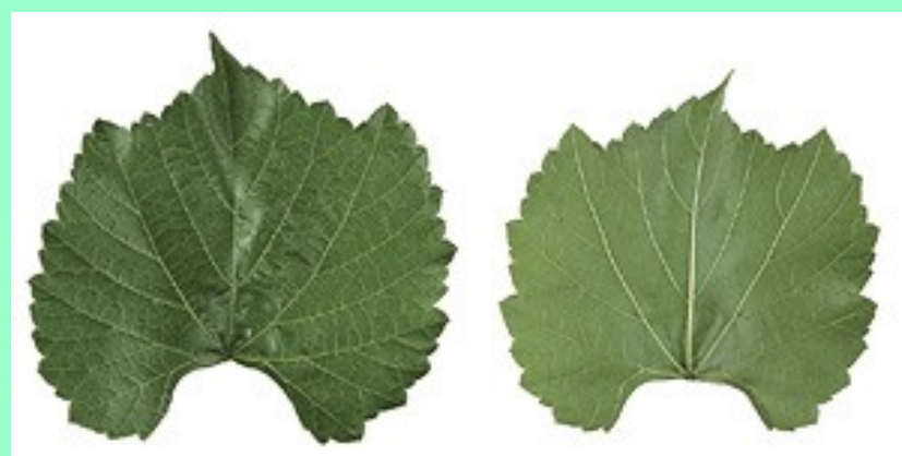
Berlandieri x Rupestris Ruggeri 140