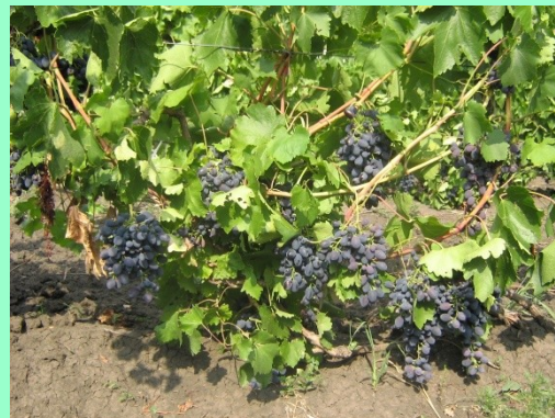
Маточники привоя обыкновенные