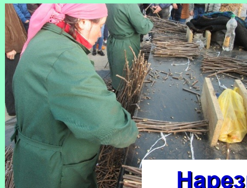
Нарезка подвоя 38-40 см