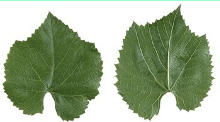
Berlandieri x Riparia SO4