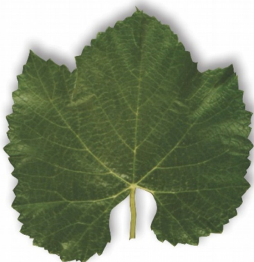
Chasselas x Berlandieri 41