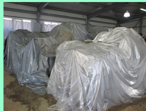
Предпрививочная стратификация подвоя (подгон)