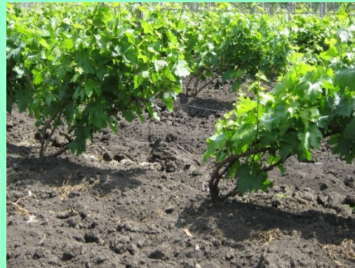
Маточники привоя интенсивные