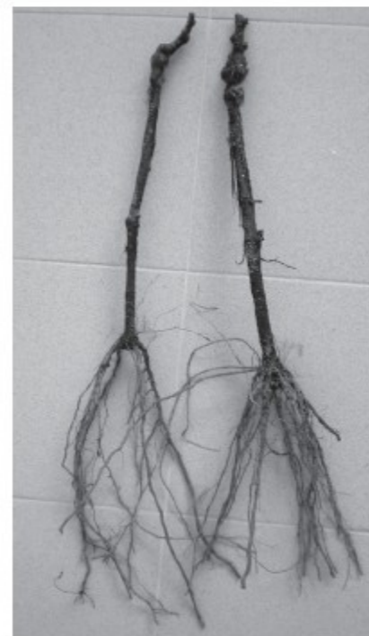
Рис. 2.3.3. Однолетние вызревшие стандарт- ные привитые саженцы после хранения

Саженцы подвоя с последующей прививкой на месте