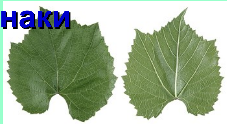
Berlandieri x Riparia Kobber 5 BB