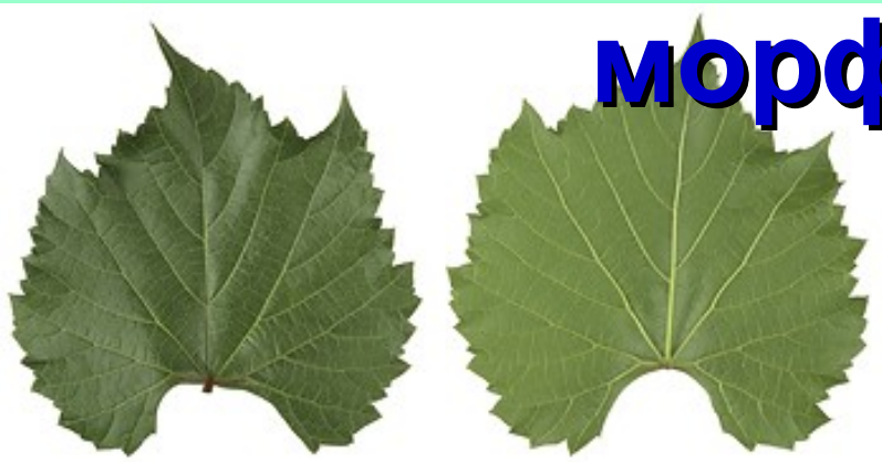
Riparia x Rupestris 101-14