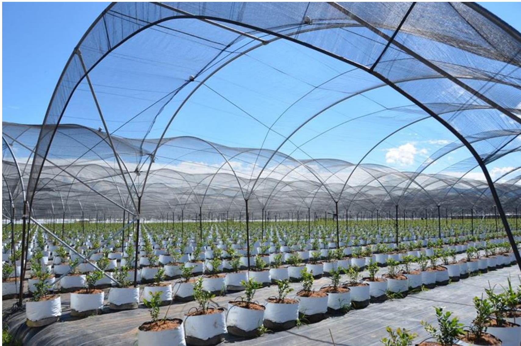
Малообъемное выращивание голубики (защищенный грунт)